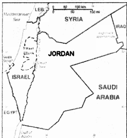
שטחה של ממלכת ירדן בין השנים 1948–1967

בין 1948 ל-1967 שלטה ירדן במזרח ירושלים ובשטחי יהודה ושומרון, לאחר שבסיומו של המנדט הבריטי, כבשה את שטחים אלו, אשר הוכרו כשטח המיועד למדינה יהודית במסגרת הצהרת בלפור ב-1917 [1] , בעוד תוכנית החלוקה מ-1947 ייעדה את רובם למדינה הערבית. במהלך מלחמת העצמאות השתלט הצבא הירדני על שטחי יהודה ושומרון ועל מזרח ירושלים, וב-1950 הכריזה ירדן על סיפוח שטחים אלו לשטחה הריבוני. הסיפוח לא הוכר בינלאומית (למעט הכרה על ידי בריטניה, עיראק ופקיסטן), ואף הייתה כלפיו התנגדות מצד הליגה הערבית.