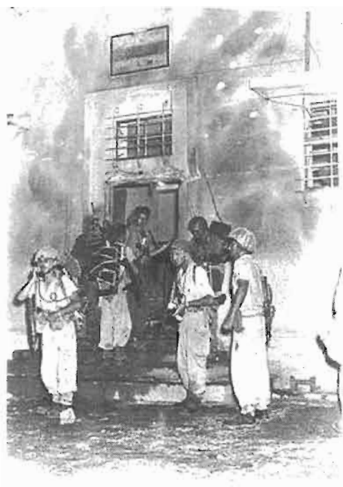
חיילי צה"ל בפתח בניין משטרת קלקיליה