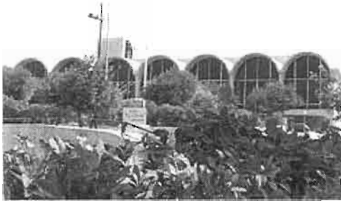
מלון אינטרקונטיננטל אשר נבנה במזרח ירושלים, בעת הכיבוש הירדני, מעל בית הקברות היהודי שבהר הזיתים

ב-1 בדצמבר 1948 ערך המלך עבדאללה את קונגרס יריחו, שבו הוחלט על איחוד של הגדה המערבית עם ממלכת ירדן. ב-24 באפריל 1950 סיפחה ירדן באופן רשמי את שטחי יהודה ושומרון, [3] והעניקה לכל תושבי האזור אזרחות ירדנית (בכך הייתה ירדן למדינה היחידה מבין ארצות ערב שהעניקה אזרחות לפליטים פלסטינים). הסיפוח גרר גינויים רחבים ממדינות רבות, ואף גרר הצעה לסילוקה של ירדן מהליגה הערבית. [4] גם ממשלת ישראל פרסמה הודעה רשמית בה הובעה התנגדות לסיפוח [5] הסיפוח הוכר אך ורק על ידי בריטניה (שיחד עם ההכרה בסיפוח הכירה דה יורה במדינת ישראל, ודה פקטו בשליטת ירדן וישראל בחלקי ירושלים שבשליטתן), [6] ובמידה מצומצמת על ידי מדינות נוספות. אזור יהודה ושומרון קיבל כ-30 מושבים בפרלמנט הירדני, באופן יחסי לגודל האוכלוסייה שבו (כחצי מאוכלוסיית ירדן בתקופה זו).