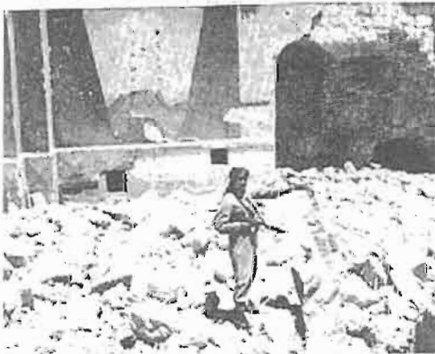
חייל הלגיון הערבי עומד בתוך הריסות בית הכנסת החורבה, יוני 1948

במלחמת העצמאות נלחם צבא ירדן (שנקרא אז הלגיון הערבי) באזור ירושלים ועמק בית שאן. עוד בטרם הוכרזה המדינה פתח הלגיון בהרעשה כבדה משטח עבר הירדן על קיבוץ גשר ומצודת המשטרה בנהריים, שעל פי החלטת החלוקה נועדו להיכלל בשטח המדינה היהודית, הפגזה שנמשכה שלושה ימים בין 27 ל-30 באפריל 1948. נוסף על כך, נותרו בשטחי יהודה ושומרון חלק מיחידות הלגיון ששימשו בשירות הבריטים במשימות משמר גם לאחר המועד האחרון לעזיבת הבריטים את הארץ, יחידות שבין השאר נטלו חלק בהתקפה על גוש עציון ורמת רחל. בראשית מאי 1948 נכנס הצבא הירדני לשטחי יהודה ושומרון ולמזרח ירושלים, והשתלט על השטח הערבי שפינו הבריטים. ערב ההכרזה על הקמת המדינה כבש הצבא הירדני את גוש עציון, כיבוש שגרר את פינויים של נווה יעקב - עטרות ושל בית הערבה. הרובע היהודי בעיר העתיקה נכבש אף הוא. קרבות קשים נערכו עם הלגיון באזור לטרון, בשטח העירוני של ירושלים וסביבתה. המהלכים העיקריים בחזית הירדנית התרחשו ברובם עד ההפוגה השנייה בקיץ 1948.