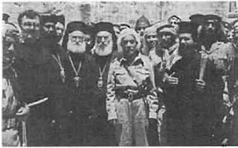
המלך עבדאללה הראשון בכנסיית הקבר, 29 במאי 1948

שטח יהודה ושומרון היה לאורך מרבית ההיסטוריה חלק מארץ ישראל, ונשלט על ידי גורם שלטוני אחד ששלט גם על שאר חלקי הארץ. מאז 1922 נמצא כל שטחה של ארץ ישראל שממערב לנהר הירדן, ובכלל זה שטח יהודה ושומרון, במסגרת המנדט הבריטי. תוכנית החלוקה שפורסמה ב-1947 חילקה את הארץ למספר יחידות עם מעברים צרים בנקודות מפגש, שמהם הורכבה מדינה יהודית ומדינה ערבית, כאשר המפתח לחלוקה היה בעיקרו שיקול דמוגרפי של ריכוזי אלוסייה יהודית וערבית. בשל כך יועד אזור יהודה ושומרון להיות חלק מהמדינה הערבית, בעוד ירושלים וסביבתה הייתה מתוכננת להיות תחת משטר בינלאומי. תוכנית החלוקה נדחתה על ידי הערבים.